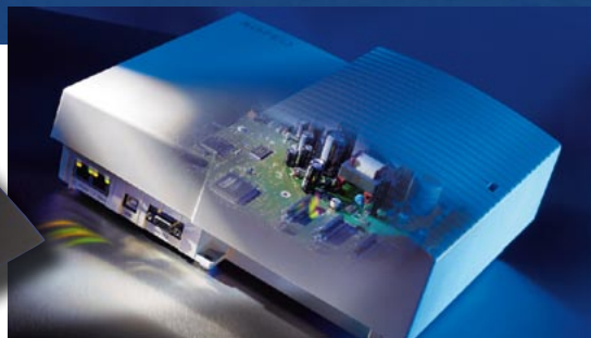
TECHNIK DIE BEGEISTERT: AirGO setzt europaweit die unterschiedlichsten Telekommunikationsgeräte von AGFEO ein.